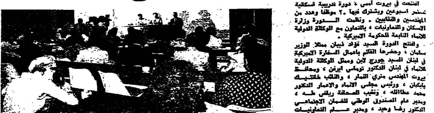
افتتاح الدورة التدريبية الاسكانية